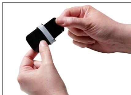
Płytki są łatwe w użyciu i wygodne dla pacjenta jak klisza.

Wyraźne i ostre zdjęcia uzyskane za pomocą skanera płytek wewnątrzustnych KaVo Scan eXam™ One precyzyjnie odtwarzają skalę szarości, aby dokładnie przedstawić niezbędne informacje diagnostyczne z najdrobniejszymi szczegółami. Po prostu wprowadź płytkę obrazową.