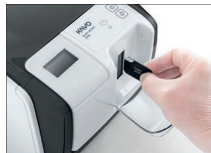
Skaner jest prosty w obsłudze i zajmuje mało miejsca.